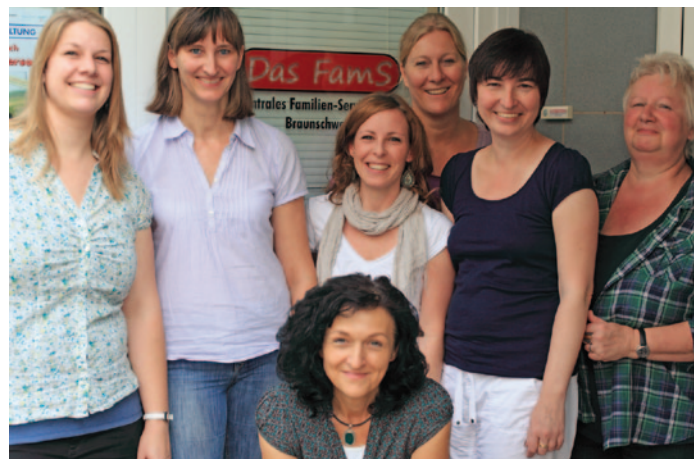
Das aktuelle Das FamS-Team